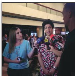
Simposio Perspectivas Sociales "Con Responsabilidad Social Ganamos Todos" VENAMCHAM