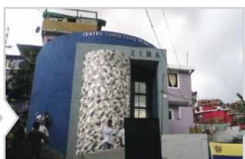
José Felix Ribas