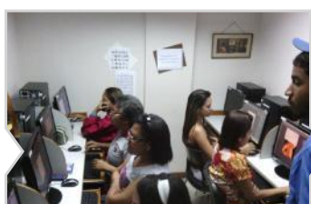
Catia la Mar